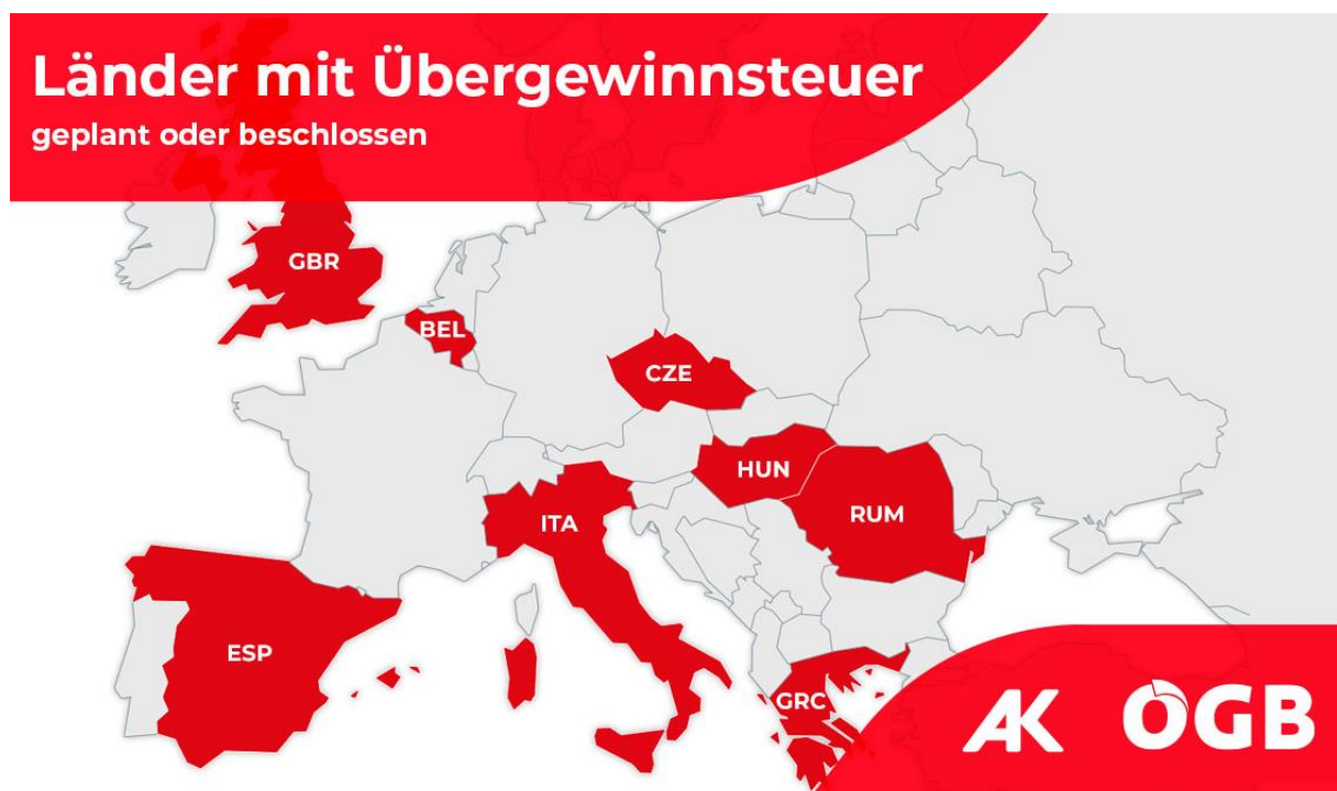
Abbildung 1: Länder mit Übergewinnsteuern

In vielen Ländern Europas wird deshalb schon länger über die Einführung von Übergewinnsteuern im Energiesektor diskutiert. Viele Staaten wie Rumänien, Italien, Spanien, Ungarn oder Großbritannien haben bereits unterschiedliche Modelle der Besteuerung umgesetzt. In weiteren Staaten wie Belgien oder Deutschland finden intensive Debatten statt. Zuletzt hat die tschechische Regierung angekündigt, eine Übergewinnsteuer auf Energiekonzerne einführen zu wollen.